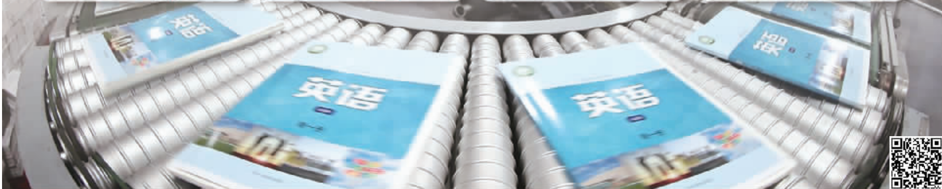
教材在到达孩子们手中之前，要经历编辑、排版、印刷、质检等几十道工序，每个环节都蕴含着“凤凰人”的匠心和汗水 扫码看视频