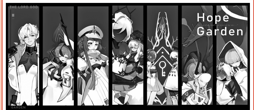
小思实习时的原画作品