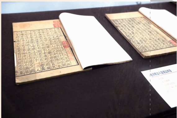
宋刻本《龙川略志》《龙川别志》