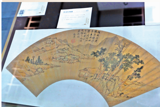
“明四家”题画的金扇面