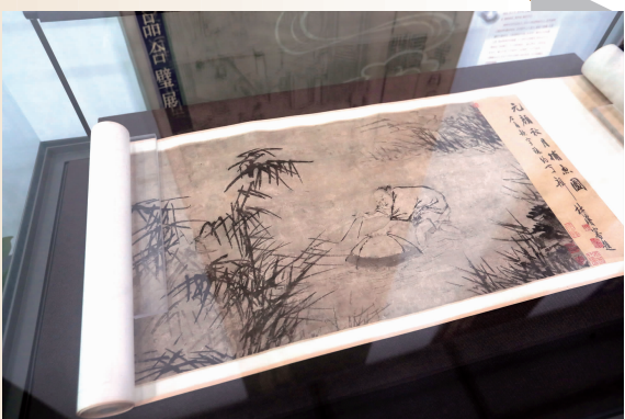
元代画家颜辉的《捕鱼图》