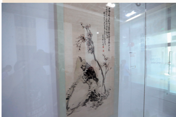
清代画家吴昌硕的《老梅怪石图》