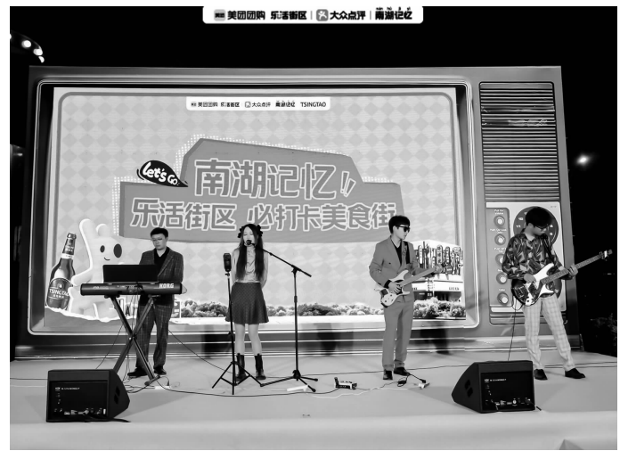
街区有很多怀旧元素

快报讯(通讯员 建邺 记者 李娜)8月24日,由南京市建邺区商务局、建邺区城建集团、莫愁湖街道共同主办的“南湖记忆”乐活街区暨大众点评必打卡美食街开街仪式正式启动,南湖记忆街区通过美团“乐活街区”与“大众点评必系列IP”焕新升级,推进“线上+线下”街区建设,推动消费提质扩容。