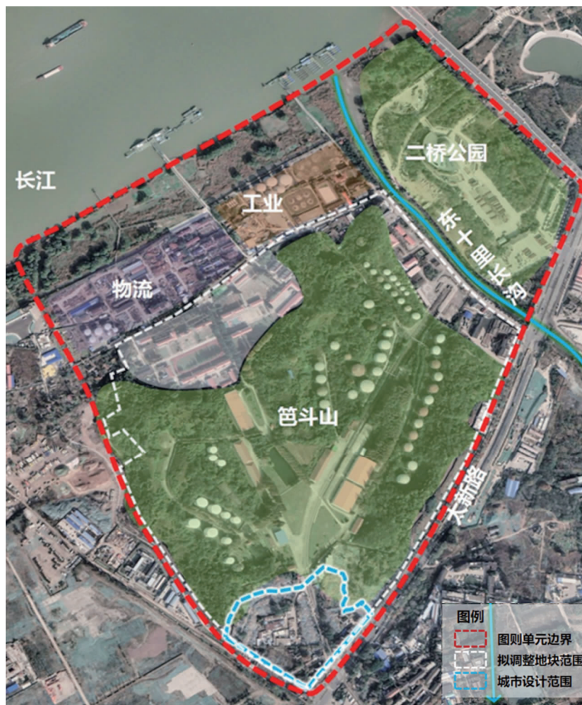
顾家村地块调整范围现状图