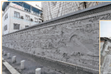
刻在墙上的《运河威墅堰全景图》