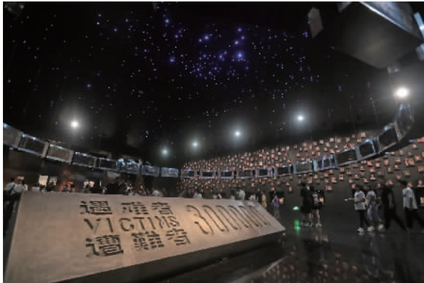
参观南京大屠杀史实陈列馆