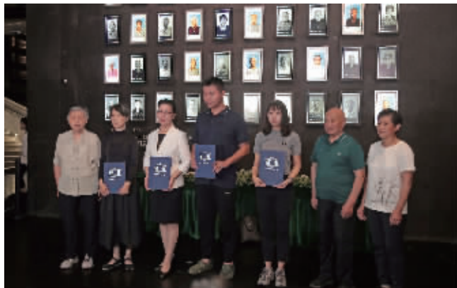
颁发南京大屠杀历史记忆传承人证书

78年前的今天,日本宣布无条件投降。惨绝人寰的南京大屠杀惨案是中国历史上最黑暗的一页,是南京永远不能忘却的沉痛记忆!8月15日上午,“南京永远不会忘记——南京大屠杀历史记忆传承主题活动”在侵华日军南京大屠杀遇难同胞纪念馆公祭广场和《南京大屠杀史实展》展区举行。第二批共10名南京大屠杀幸存者后代接过“南京大屠杀历史记忆传承人”证书,这意味着越来越多的幸存者后代接过传承历史记忆、传播历史真相的接力棒。