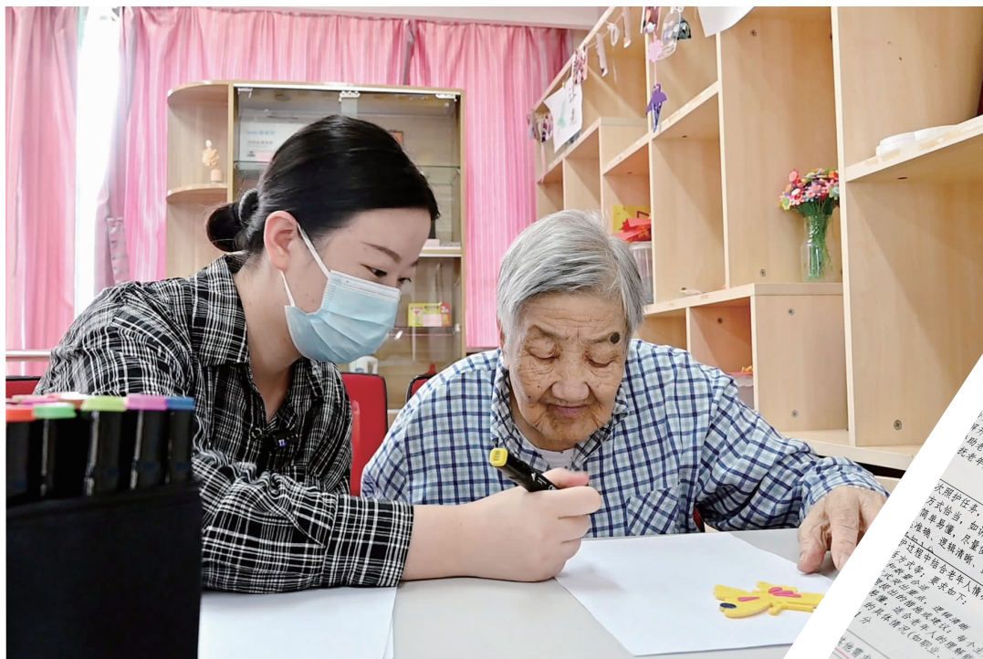
记者带老人进行认知康复训练——绘画