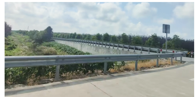
启东兴东桥附近加装的“二波板”

本报讯(记者李娜)高速公路因为安全等级提升或者改扩建,会更换下大量的波形梁护栏板(以下简称“护栏板”),这些护栏板通常还未达到最低使用年限,如何实现再利用、价值最大化?8月9日,现代快报记者了解到,近期江苏召开波形梁护栏板再利用论证研讨会,最终取得一致意见:高速公路更换下来的波形梁护栏板,经检测合格后可以再利用。据悉,目前启东已有70公里农村公路用上这种护栏板,今年年底之前还计划加装400公里。