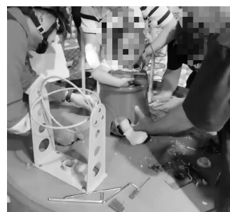
▲消防人员赶到现场进行救援 视频截图 ▶扫码看视频