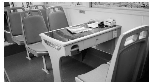
公交车上的小桌子