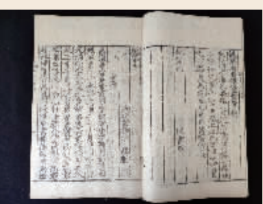
宋刻元明递修本《陈书》