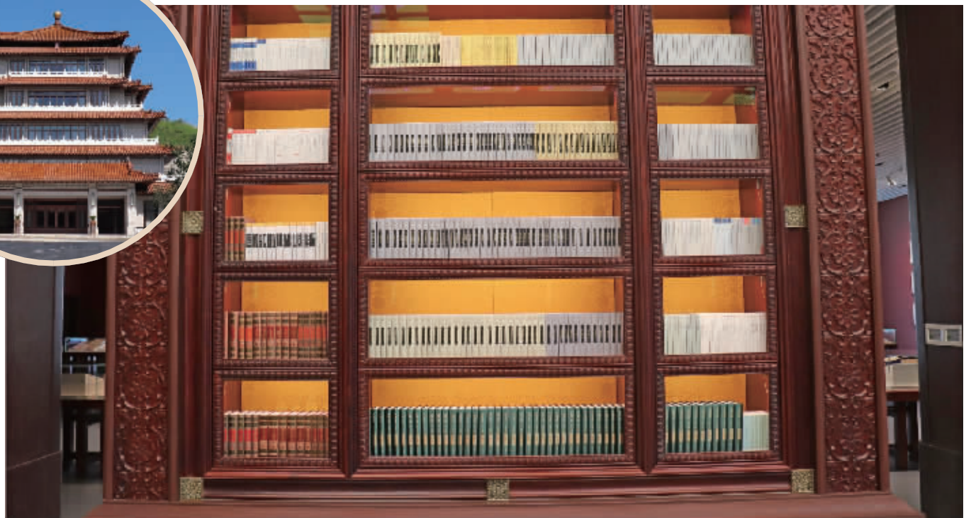
国家书房收藏《江苏文库》