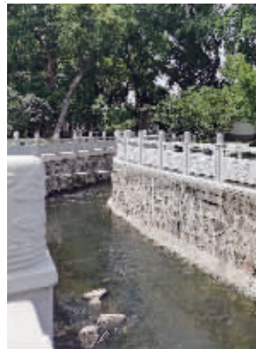
香林寺沟现状