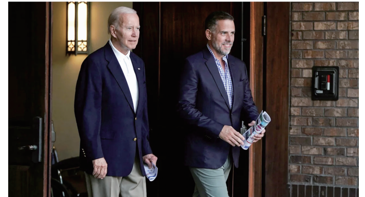
亨特·拜登(右)与父亲乔·拜登