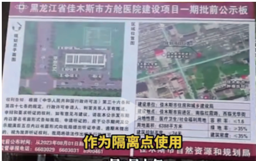
方舱医院建设项目公示牌 视频截图

8月1日,有网友发视频称黑龙江省佳木斯市前进区附近居民区正在设立方舱医院,质疑道:“为何全国都在拆除方舱医院,这边的社区还在设立方舱医院?”