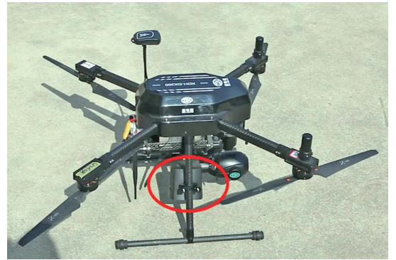
线上巡视时发现一群小孩在水塘边玩耍