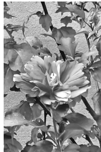
南林大二村的木槿花