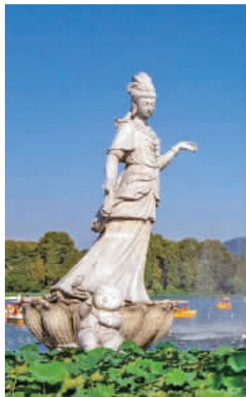
▲拆除前的“荷花仙子”雕塑;▶施工现场(扫码看视频)