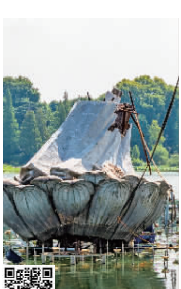
▲施工现场(扫码看视频)

快报讯(记者 张然)眼下正是南京玄武湖公园的赏荷季,12米高的“荷花仙子”可是园内莲花广场的标志性雕塑。7月24日,有市民发现,荷花仙子雕塑没了。现代快报记者从玄武湖公园管理处获悉,拆除是因为雕塑已超使用年限,年底将恢复原貌。