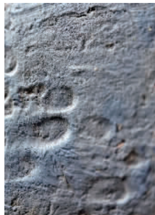
▲玄武门城砖上的手印

快报讯(记者 张然)近日,有市民发现玄武门入口门洞左侧的城墙上,有一处形似手印的按压印,与成年男性右手手中指、无名指、小拇指位置基本吻合。这个神秘手印是谁留下的?