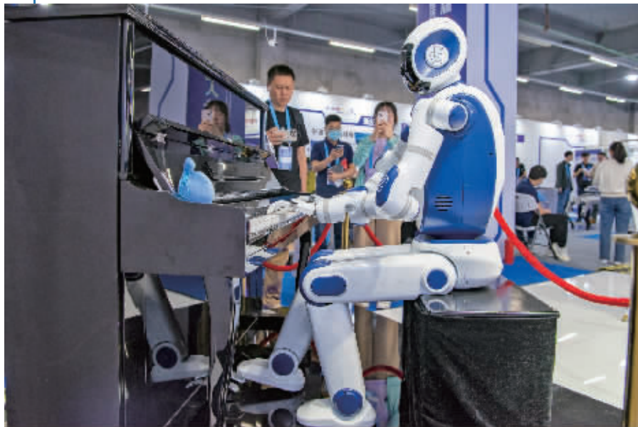
第八届中国机器人峰会上,客商欣赏机器人弹钢琴(5月24日摄)