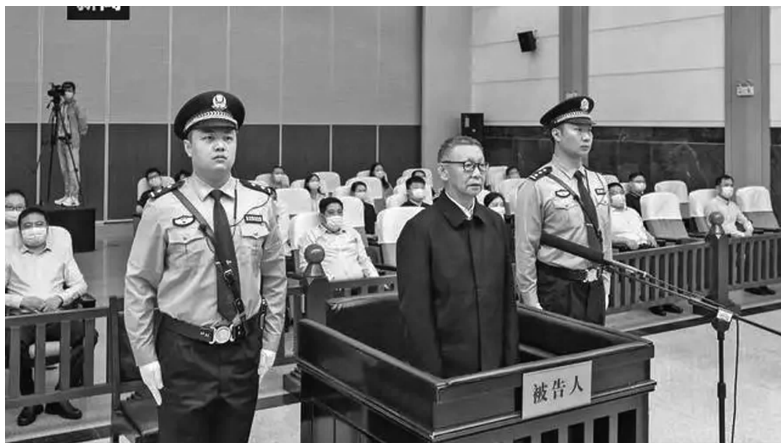
蔡鄂生受审现场

2023年7月13日,镇江市中级人民法院一审公开开庭审理了原银监会党委委员、副主席蔡鄂生受贿、利用影响力受贿、滥用职权一案。