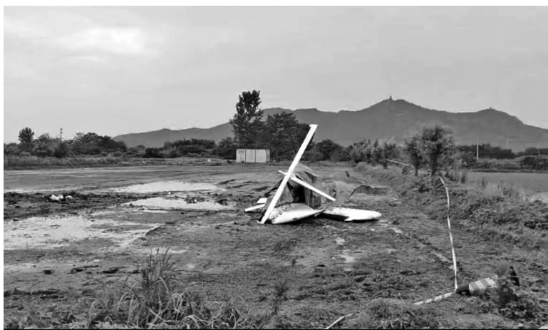
飞机坠落现场

快报讯(记者 曹德伟)7月12日下午,一架飞机坠落在镇江新区一处农田。目击者称事发地距离附近大路机场2公里不到,飞机起飞以后可能发生故障,滑翔停在农田里。7月13日晚,民航华东管理局就此起事故发布了通报。