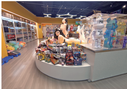
一家店内用于展示的女性手办模型几乎全裸