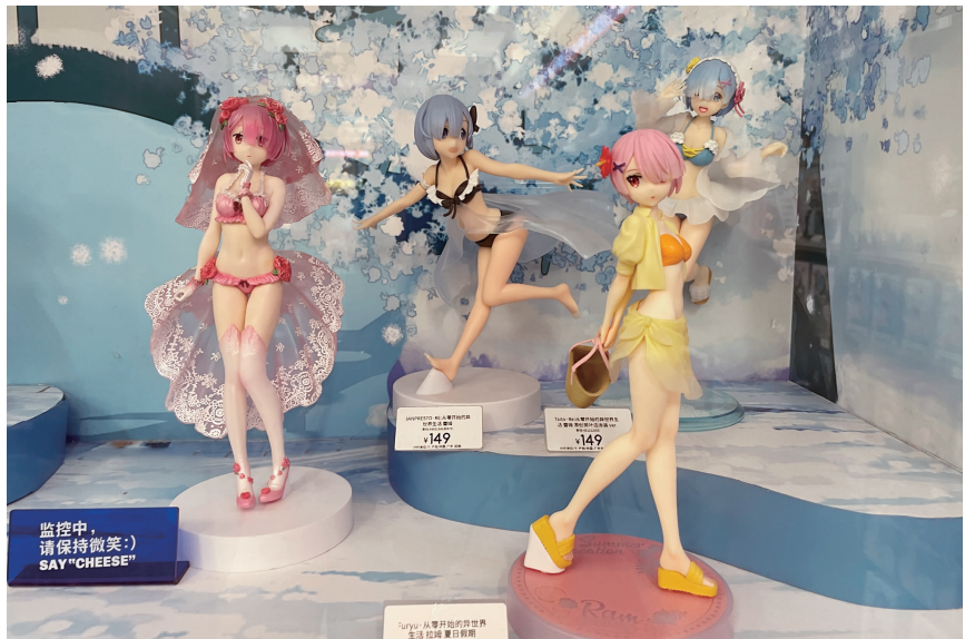
一家店内销售的女性手办穿着“清凉”