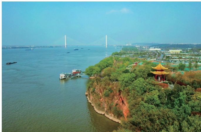
长江南京段