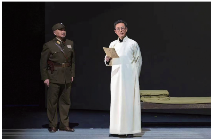
《瞿秋白》剧照