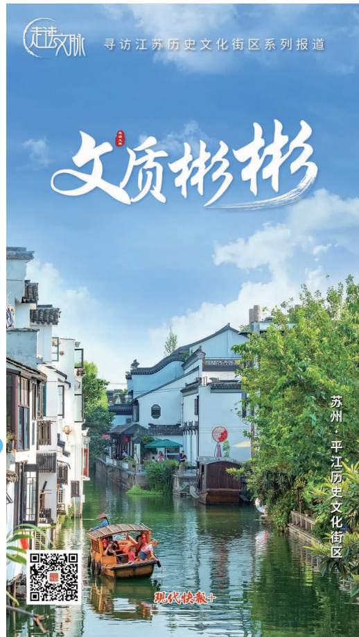
苏州·平江历史文化街区