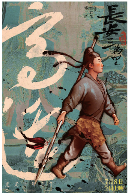
《长安三万里》高适角色海报