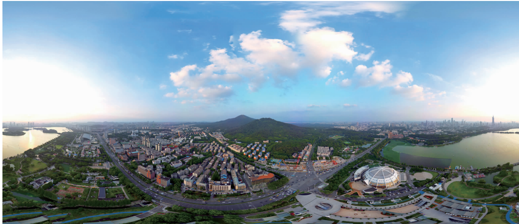
夕阳下的紫金山镶嵌在都市中的绿色明珠