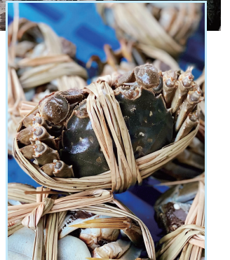
等待装箱的大闸蟹

在当天的“农云行动”培训活动中,苏州邮政介绍了邮政快递的优势,并针对本次活动给出了商家优惠的资费政策。此外,价格