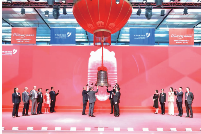
苏州朗威电子机械股份有限公司敲钟上市