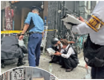
受伤人员在现场协助调查 消防人员赶到现场救援

当地时间7月3日15时15分(北京时间14时15分)左右,日本东京都港区新桥车站附近一栋大楼内发生爆炸,造成至少4人受伤。