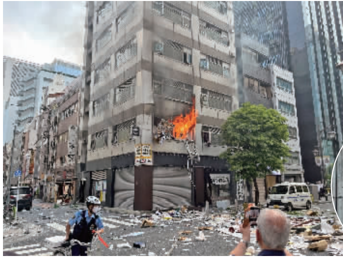
爆炸现场(手机拍摄)