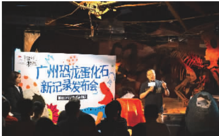
邢立达教授分享论文研究成果

经过观察与对比,研究人员将编号为HS00468的化石归入棱柱形蛋科棱柱形蛋属,推测这枚恐龙蛋完整时长为五六厘米。这类恐龙