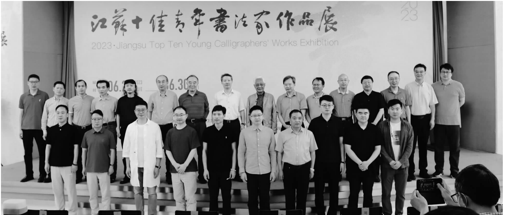
2023·江苏十佳青年书法家作品展开幕现场嘉宾合影