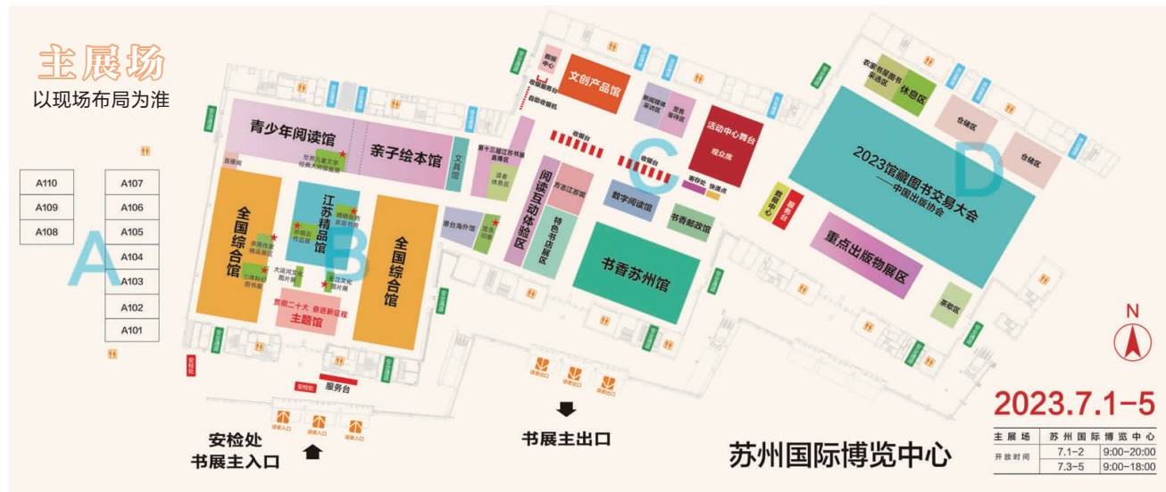
第十三届江苏书展主展场导图

本报讯(记者 张焱 王凡) 7月1日至5日,第十三届江苏书展将在苏州国际博览中心主展场和全省线上线下分展场举办,中国版协2023馆藏图书交易会同期举办。届时,500多家供应商、超16万种出版物将齐聚苏州,主展场举办各类阅读推广、行业交流活动270多场。相比往届,今年的江苏书展有哪些变化和亮点?爱书人又将获得哪些新鲜的“阅读”体验呢?