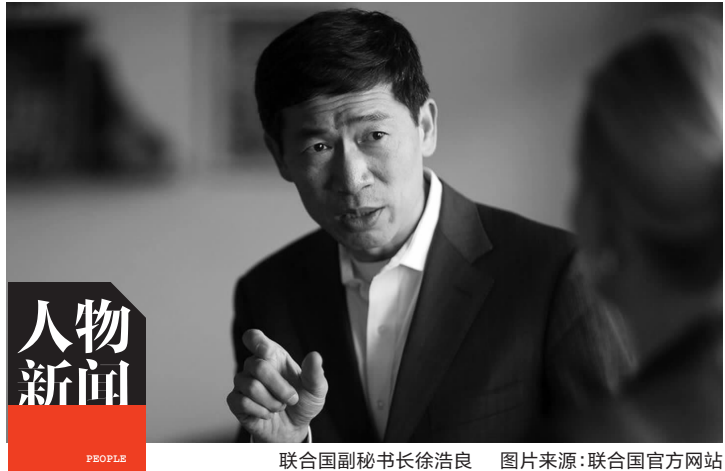
联合国副秘书长徐浩良

当地时间26日,联合国秘书长古特雷斯宣布了一个重要消息,任命来自中国的徐浩良担任联合国副秘书长兼联合国开发计划署协调署署长。