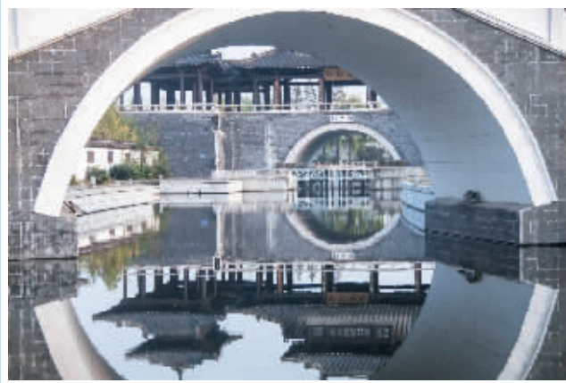
桥中见桥