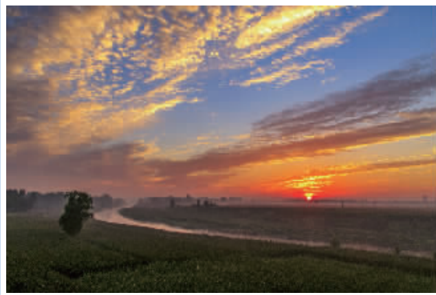
运河晨曦