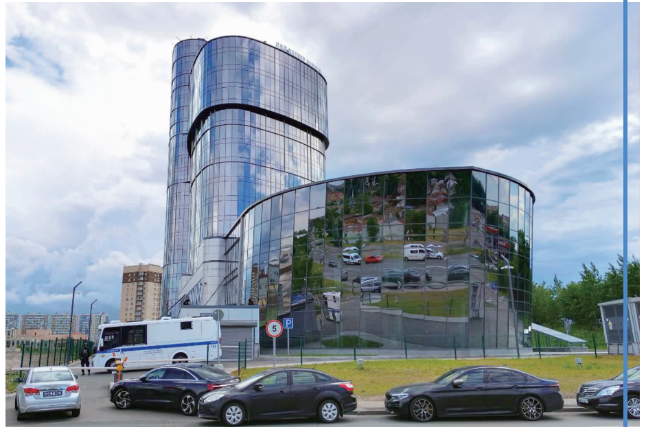
6月24日在俄罗斯圣彼得堡拍摄的被封锁的瓦格纳总部大楼

24日,俄罗斯总统普京发表电视讲话指出,所有故意走上叛变、胁迫、挑起武装叛乱之路的人必将受到惩罚。俄方将采取果断行动稳定顿河畔罗斯托夫的局势。前一天,瓦格纳组织创始人普里戈任指认俄军攻击在乌克兰作战的瓦格纳武装人员营地,下令瓦格纳向俄罗斯罗斯托夫州首府顿河畔罗斯托夫进发。