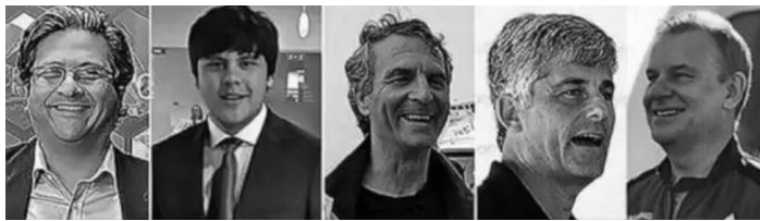
包括海洋之门CEO在内的5名乘员全部死亡