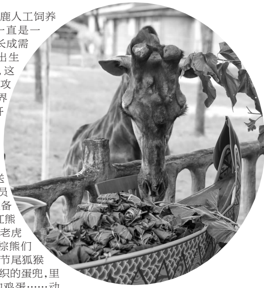
长颈鹿享用端午“龙舟”大餐

除了给长颈鹿送上端午大餐,工作人员也为园区其他动物准备了各种粽子大餐:有红熊猫最爱的苹果粽;有老虎爱吃的纯肉粽;还有棕熊们爱吃的鱼肉粽;其中节尾狐猴还悬挂着五彩绳编织的蛋兜,里面装上了它们爱吃的鸡蛋……动物们花式吃粽子的模样,吸引不少市民游客观赏拍照。 王海荣 张敏