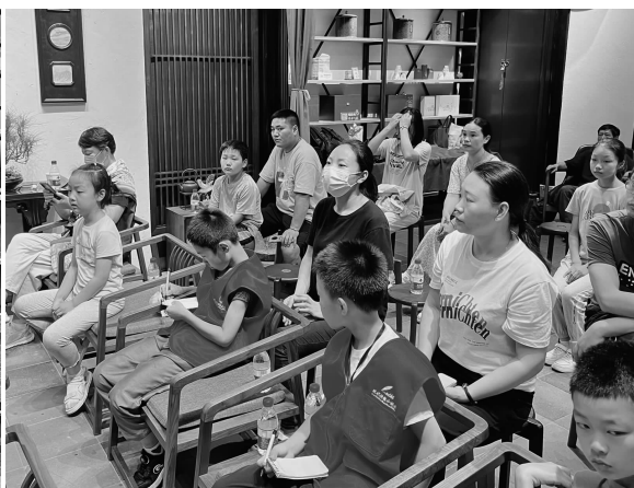
分享会现场,家长、小朋友们听得津津有味