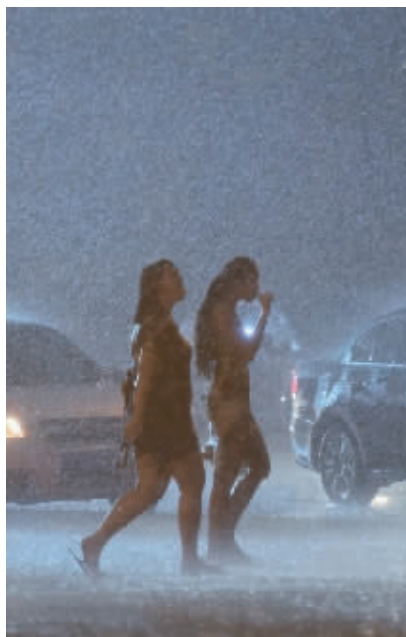
夏日疾雨,行人匆匆