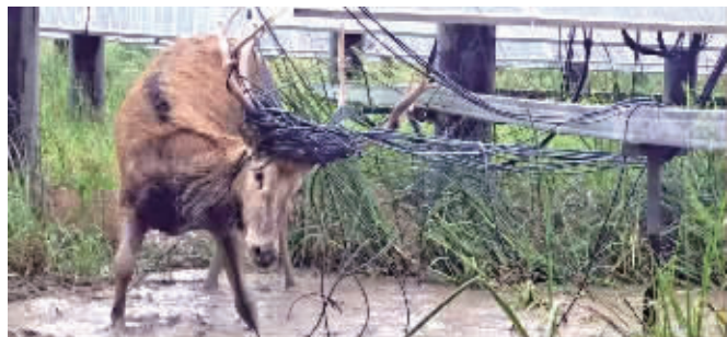
麋鹿被电线缠绕困住

麋鹿被困，在海安尚属首次。根据现场具体情况，各方人员迅速制定应急救援方案。消防部门对现场实行临时断电，自然资源部门经上级部门协调，迅速与大丰麋鹿保护区取得联系，该区技术人员