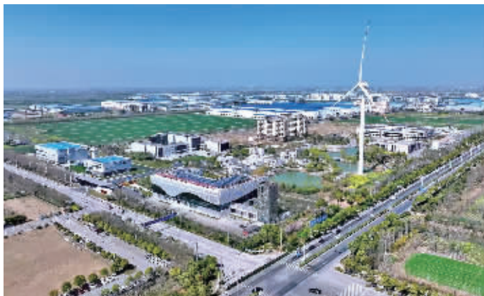
大丰经济开发区