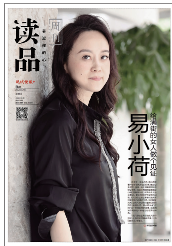
读品周刊本期看点

下一步，国家医保局将向各地征集医保便民措施典型做法和经验，总结经验成效，在全国范围内推广，并持续推出医保服务便民措施。