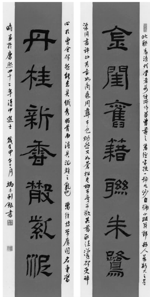
隶书对联《金闺旧籍联朱鹭，丹桂新香散紫泥》