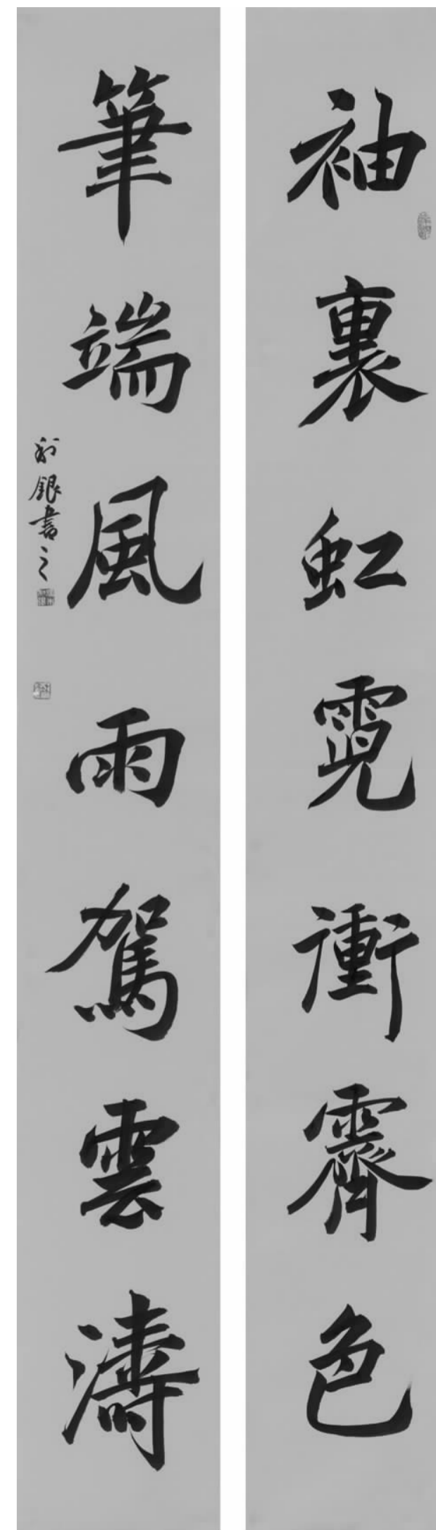
行楷对联《袖里虹霓冲霁色，笔端风雨驾云涛》