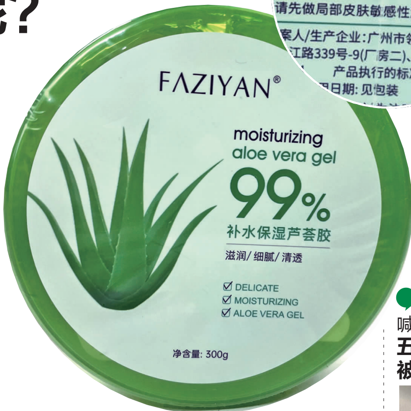
正面标注着99%补水保湿芦荟胶,且99%特别显眼