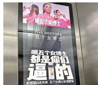
“五个女博士”此前广告

6月14日,此前广告被质疑侮辱女性的“五个女博士”被行政处罚,随后连夜在在微博上发致歉声明。