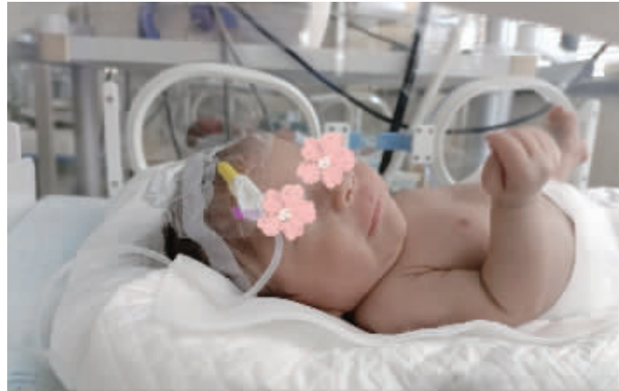
患病新生儿救治成功