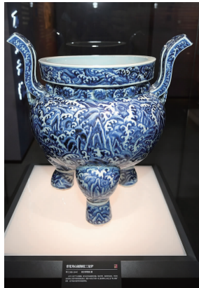
青花寿山福海纹鼎式香炉