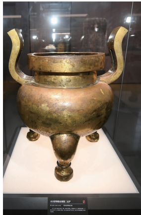
永乐款铜鎏金圆腹三足炉

来自南京博物院的明永乐青花寿山福海纹鼎式香炉、来自景德镇御窑博物院的明永乐青花江崖海水纹三足炉和来自青海省博物馆的明永乐帝赐予瞿昙寺铜鎏金圆腹三足炉首次聚首了!在独立展柜里,你可以360°全方位欣赏这三件永乐朝宫廷重器。