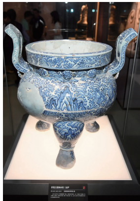
青花江崖海水纹三足炉