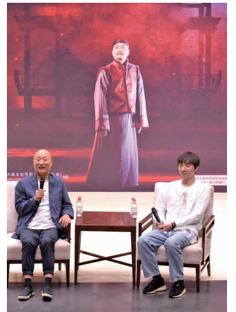
陈佩斯(左)和陈大愚

快报讯(记者 张文颖)陈佩斯来南京了!6月8日至11日,由陈佩斯率领大道文化呈现的原创话剧《惊梦》登上“2023·南京戏剧节”,在南京保利大剧院连演4场。6月7日晚,陈佩斯、陈大愚父子提前亮相,与南京观众畅聊《惊梦》创作及巡演过程中,台前幕后的故事。