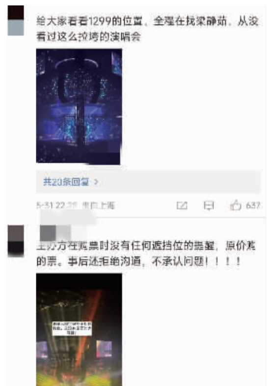
买到“柱子票”,网友纷纷吐槽 网络截图