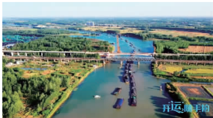
运河美景 视频截图 扫码看视频