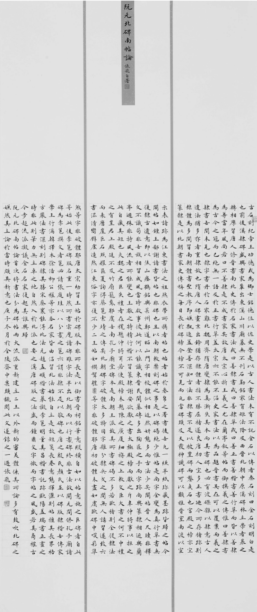
《阮元北碑南帖论》57cm×150cm 2020年

在不同的书体里,张飞释放出不同的自我和才情,面貌看似殊异,其实在有一种贯通的气质,就是超越感,就像他的字写一样,天岸是自由的理想境界,可以将法度斡旋起来,超越法度,写出自己的个性和性情,写出自然和人性中丰赡的美。(文章作者周睿系南京艺术学院美术学院教授、硕士生导师)