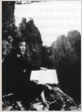
1954年李可染在黄山写生