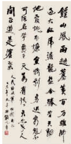
林散之草书 毛泽东《人民解放军占领南京》