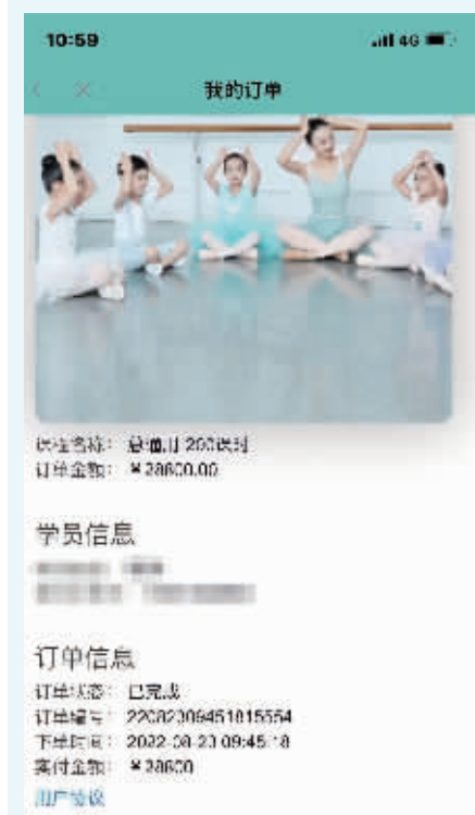
薛女士交费转账记录

薛女士对该培训机构要跑路的担心或许并不是空穴来风。5月16日,在《政风热线·我来帮你问厅长》全媒体直播节目中,南通不少家长反映,崇川区“Isee灰姑娘”少儿艺术培训机构突然闭店,致使数百位学员无法上课,家长面临退费难题。5月18日,江苏省文化和旅游厅副厅长钱宁带队赶赴南通现场督办。南通门店张贴的“告家长书”显示,因校区经营困难,多次面临现金流断裂危险。2023年,灰姑娘总部单方面发布解约公告,引发会员挤兑退费,进一步恶化了公司资金现状,不得已做出闭店决定。针对此事,崇川区文旅局协调了11家培训机构帮助家长转课,让大部分学生能得到正常的培训。