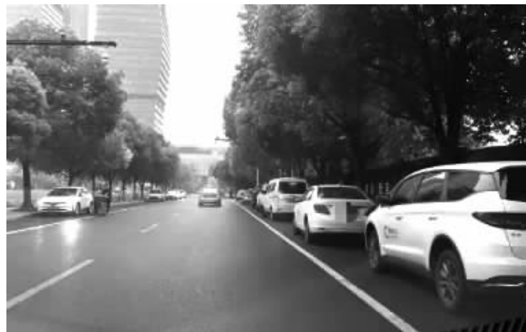
跑完早晚高峰,老程习惯把车停在滨江科技馆街“等单”