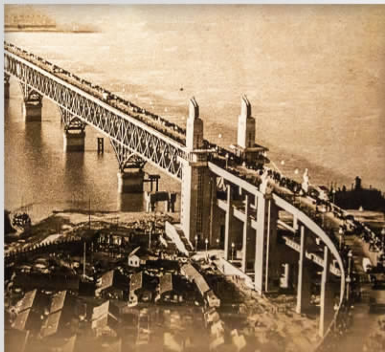
南京长江大桥