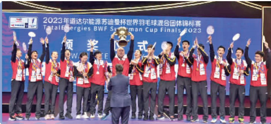
中国羽毛球队实现苏迪曼杯三连冠