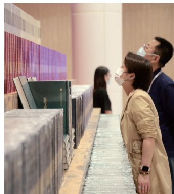
嘉宾在《江苏文库》“书墙”前驻足